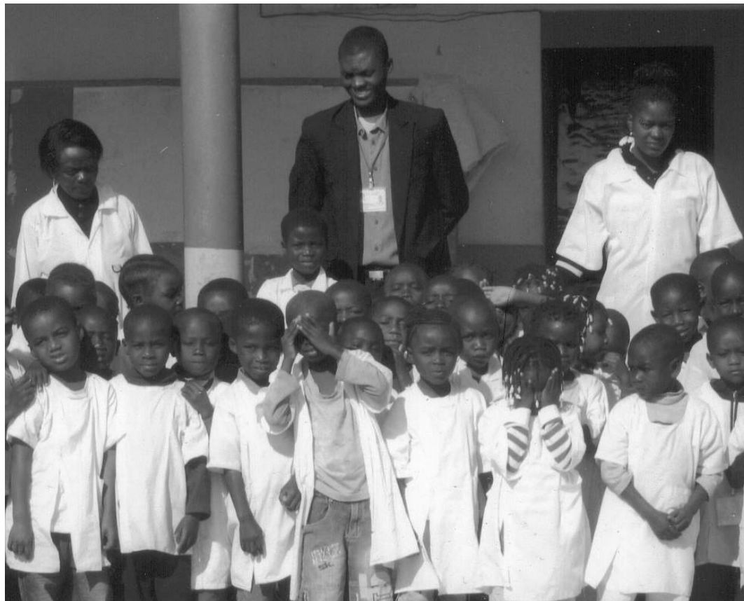
Barn utanför skolan som Agni har varit med och finansierat.

geringspartiet, ministerierna i huvudstaden Luanda, och diverse statliga, eller halvstatliga storbolag inom just olje- och diamantranden, och de stora handelsbolagen.