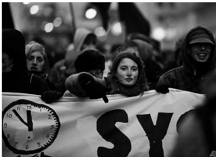
Protesterande människor utanför klimattoppmötet i Köpenhamn 2009.

Internationella konferenser används fortfarande som ett sätt att undvika gemensamma hot. Det är precis ett år sedan världens ögon riktades mot klimattoppmötet i Köpenhamn. Läget var besvärligt. Målet var utsläppsminskningar, men samtidigt hänger ökande utsläppen starkt samman med ekonomisk tillväxt. Inga delegationer hade egentligen mandat att sluta ett avtal som skulle innebära att man tappade mark i det